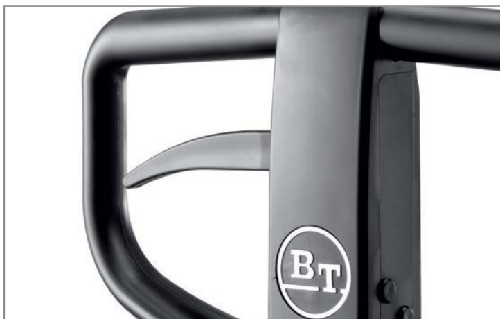
Удобная рукоятка с полимерным покрытием