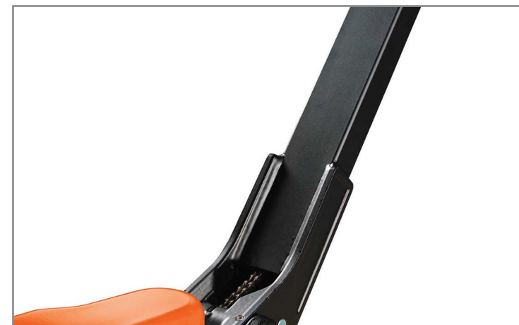
Роботизированная сварка частей рычага гарантирует его целостность при высоких нагрузках