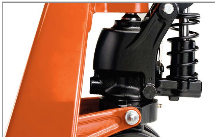
Усиленный шток клапана с регулировкой и сдвоенные шарикоподшипники