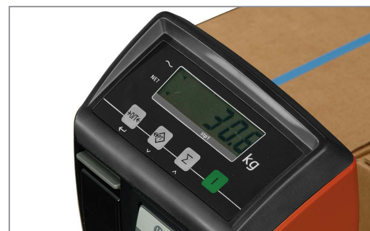
Весы для точного контроля груза и лучшей продуктивности (опция)